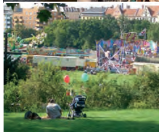
Arriba: Torres del puente Oberbaumbrücke Abajo: Victoriapark