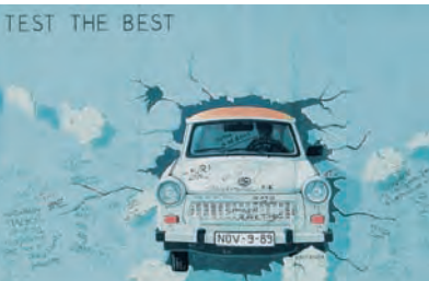
Pinturas sobre el antiguo muro de Berlín, en East Side Gallery