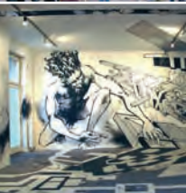
Arriba: Fachada pintada en Kreuzberg Abajo: Centro de arte Künstlerhaus Bethanien