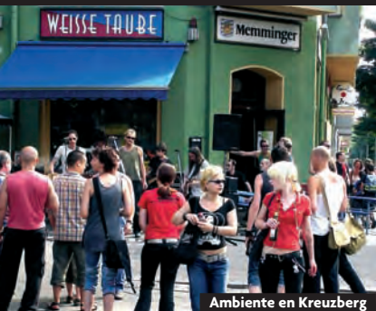
Ambiente en Kreuzberg